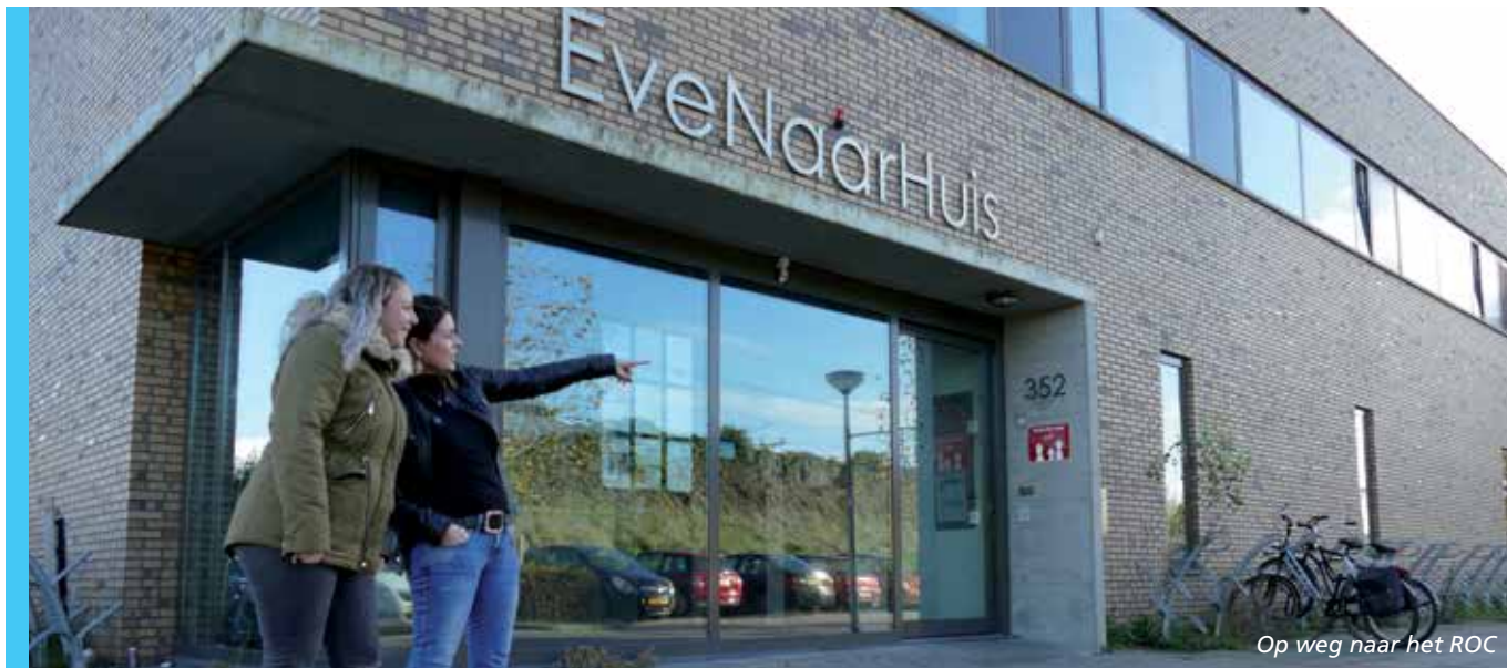
Op weg naar het ROC