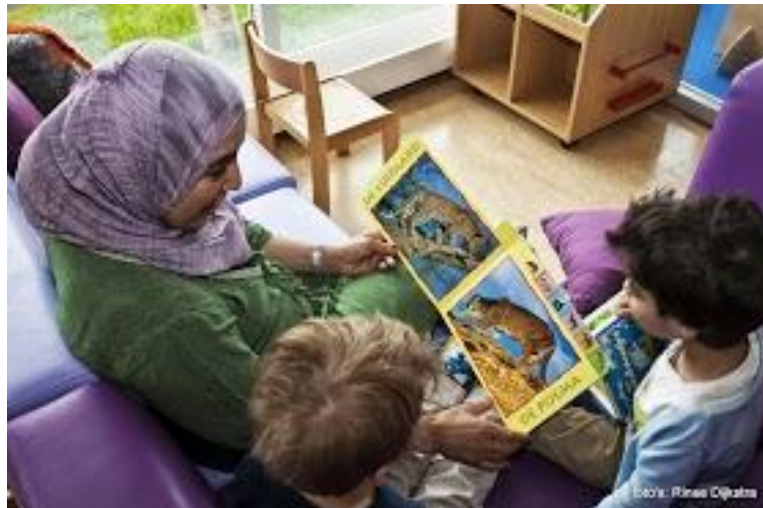
Ouderbetrokkenheid leidt tot verbinding en begrip wat leidt tot betere leerresultaten bij de kinderen

Ouderbetrokkenheid leidt tot verbinding en begrip wat leidt tot betere leerresultaten bij de kinderen. Brede school "de @rchipel" is mede daarom gericht op draagvlak en betrokkenheid creëren bij ouders/verzorgers. Alle kinderen uit de wijk zijn welkom om mee te doen aan het naschoolse activiteitenaanbod.