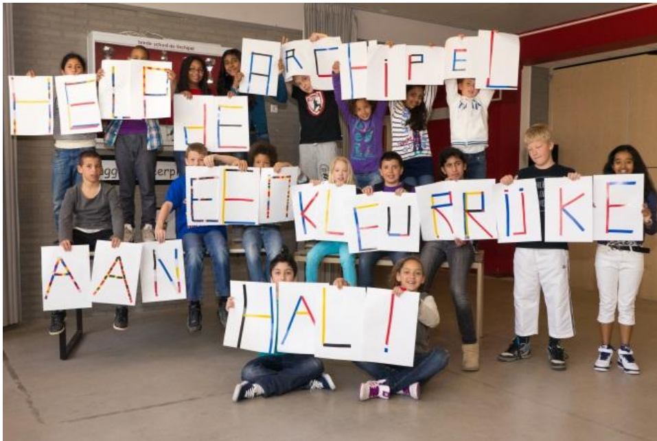
Deze foto vergezeld de aanvraag voor het Rabobank coöperatie fonds waarmee we de hal hebben getransformeerd van een saaie en kille hal naar een frisse Mondriaan-hal, waar ruimte is om kinderkunst te exposeren