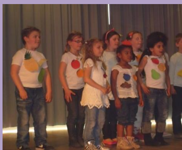
Talent ontwikkelen we samen!