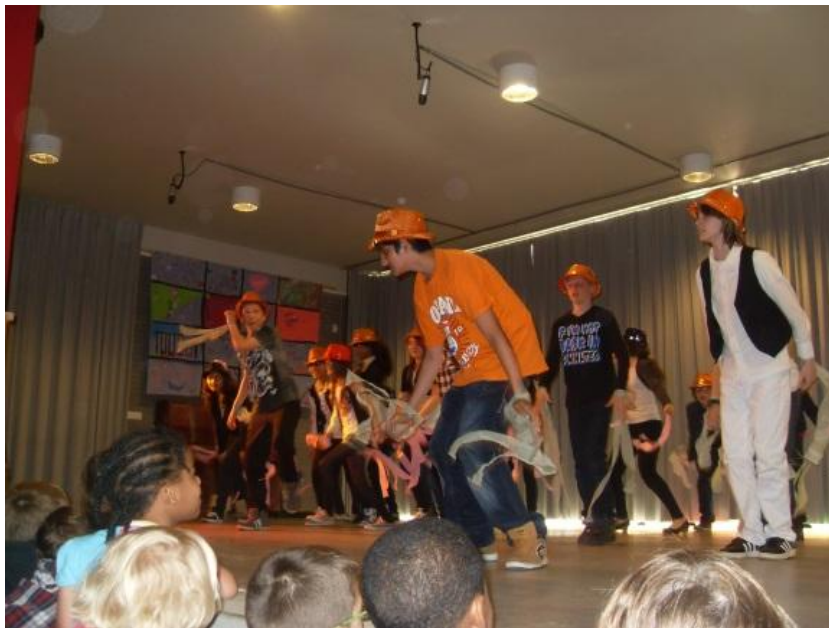
Het Open Podium op “de Archipel” in samenwerking met gemeente Almere