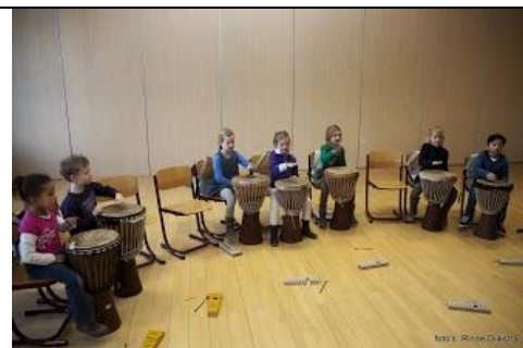
Niet structureel, wel als workshop tijdens Afrika project: Djembé lessen

Daarnaast worden er clinics georganiseerd met Combinatiefunctionarissen: sportverenigingen, TIO, een dansschool, de Nieuwe Bibliotheek e.a.