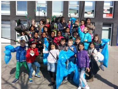
Buurtproject "Eilandenbuurt schoon"