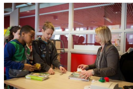
Boeken halen in "De Boekanier", onze eigen vestiging van de NieuweBibliotheek

Maatschappelijk; De brede school richt zich vooral op kinderen van 2 t/m 12 jaar. Daarnaast bieden we via onze activiteitenkalender activiteiten voor volwassen buurtbewoners aan. Ook is in school een dependance van de openbare bibliotheek.