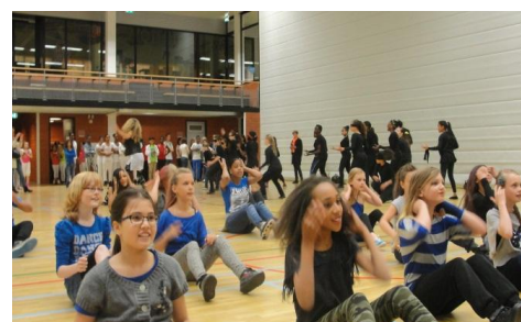
Tijdens het Dance kampioenschap in de Topsporthal namen de talenten van "de @rchipel" het met succes op tegen 3 andere basisscholen en 3 middelbare scholen